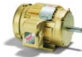
Figure 1 – Moteur à rendement supérieur

La valeur nominale du moteur indiquée sur la plaque signalétique est fonction du nombre de chevaux-puissance ou horsepower (HP) produits à partir d'un fonctionnement en continu à plein régime (ou à pleine charge). La quantité d'énergie requise pour générer la puissance nominale varie d'un moteur à l'autre, les plus performants nécessitant moins de puissance d'entrée pour donner le même rendement que les modèles moins efficaces.