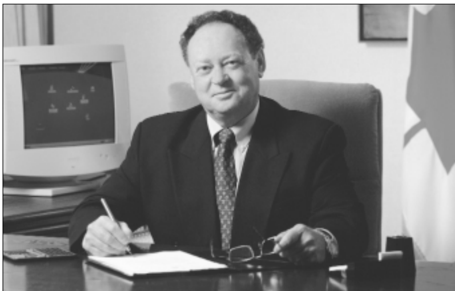
Dr Gilbert Normand, Secrétaire d'État (Sciences, Recherche et Développement)

Au cours des récentes années, particulièrement les trois dernières, le gouvernement du Canada a investi des ressources importantes dans la S-T. Nous avons ainsi fait la preuve de notre engagement solide en matière de recherche. Le gouvernement s'oriente maintenant vers une approche à la fois globale et ciblée. Globale parce qu'il investit dans tous les canaux de recherche – les collèges, les universités, l'industrie, les laboratoires, les centres de recherche. Ciblée parce qu'il privilégie les secteurs des sciences considérés comme névralgiques. Évidemment, il n'est pas question de négliger les autres champs de recherche, mais de faire porter les efforts d'abord et avant tout sur les domaines où le Canada excelle, comme la génétique, l'ingénierie, la recherche médicale et pharmaceutique. Le gouvernement entend donc stimuler la