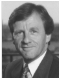
Le ministre de l'Industrie, Allan Rock

M. Rock est entré en politique en 1993, après une brillante carrière d'avocat plaidant. Il a été nommé ministre de la Santé en juin 1997. À titre de ministre de la Santé, il s'est donné comme priorité