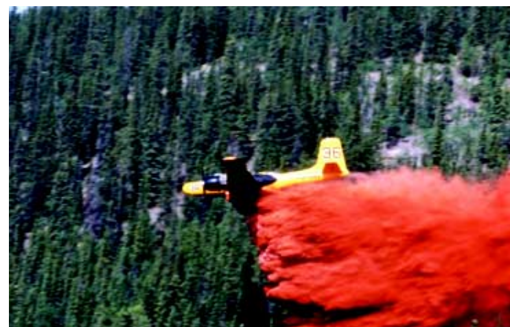
Des bombardiers à eau sont utilisés pour arroser le périmètre de l'incendie avec de l'eau additionnée de produits « retardants », afin de stopper la propagation du feu.

Lorsqu'on établit une stratégie de gestion des incendies, il faut tenir compte des risques et des dangers auxquels d'abord la population, puis les biens sont exposés. Ainsi, les incendies qui posent un danger