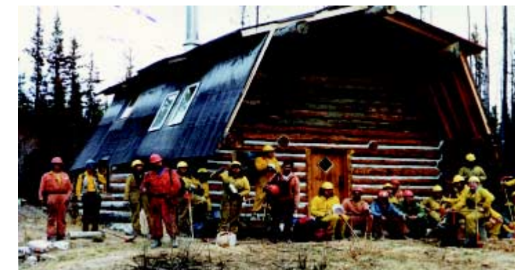
Des pompiers du Yukon ont sauvé cette maison des flammes, lors de l'incendie de Minto en 1995.

Des réunions et des séances d'information publiques se sont tenues au cours des ans et diverses études ont été effectuées pour définir et évaluer ce que les citoyens tiennent à voir protéger contre les feux de forêt. La Direction de la gestion des feux de forêt du MAINC a pris note des recommandations qui lui ont été faites au sujet de la politique de gestion et de zonage en matière