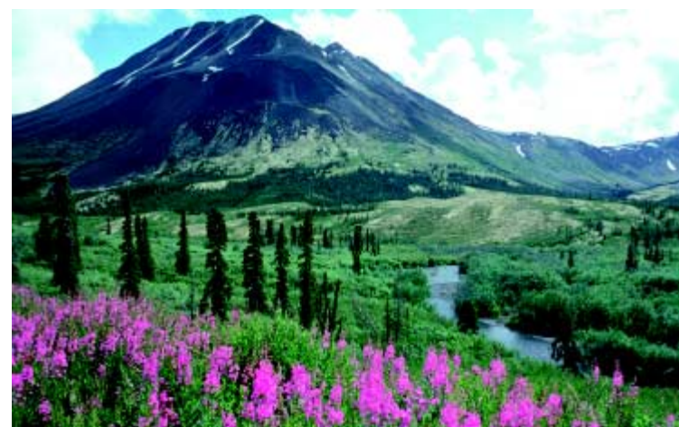
La Vergerette du Canada est l'une des premières plantes à apparaître sur les terrains dévastés par un incendie.

L'objet de l'exercice de consultation est d'élaborer une politique de gestion des feux de forêt qui concilie les impératifs de gérance de l'environnement, de protection de la propriété, des infrastructures et des communautés et de sauvegarde des sites culturels et patrimoniaux. La nouvelle politique de zonage en fonction des feux de forêt sera fondée sur le principe voulant que les responsabilités soient partagées avec les Yukonnais qui ont un intérêt foncier. Le nouveau système sera fondé sur des valeurs établies d'un commun accord, sera conforme aux principes de gestion écosystémique et sera dynamique et adapté aux valeurs identifiées au cours du processus de consultation.