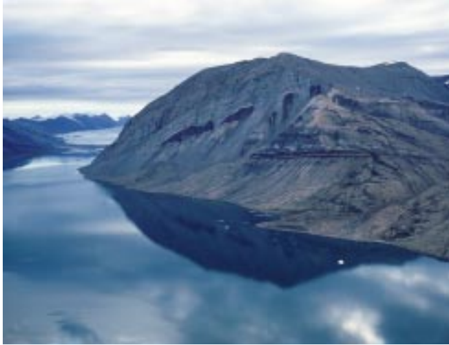
Le fjord Tanquary et les monts Osborne, situés dans le parc national canadien le plus au nord, Quttinirpaaq