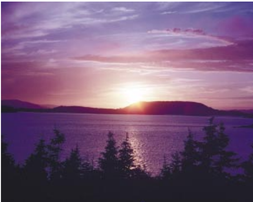
Parc national Terra-Nova