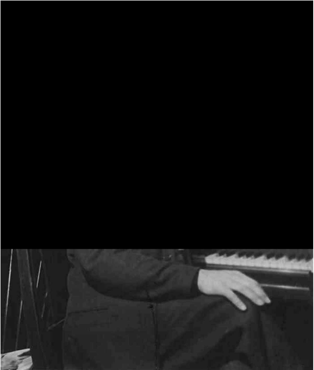
Rodolphe Mathieu, Montréal, [ca 1950]. Tous droits réservés. La reproduction aux fins commerciales est interdite.