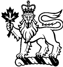
L'étendard de la gouverneure générale symbolise la souveraineté de la reine au Canada

La gouverneure générale représente la reine au Canada qui la nomme sur recommandation du premier ministre, généralement pour une période de cinq ans. Une des plus importantes fonctions de la gouverneure générale est de s'assurer que le Canada est toujours servi par un premier ministre. Si, par exemple, aucun parti n'est majoritaire à la suite d'élections, ou si le premier ministre décède en fonction, c'est à la gouverneure générale qu'il appartient de choisir le prochain premier ministre.