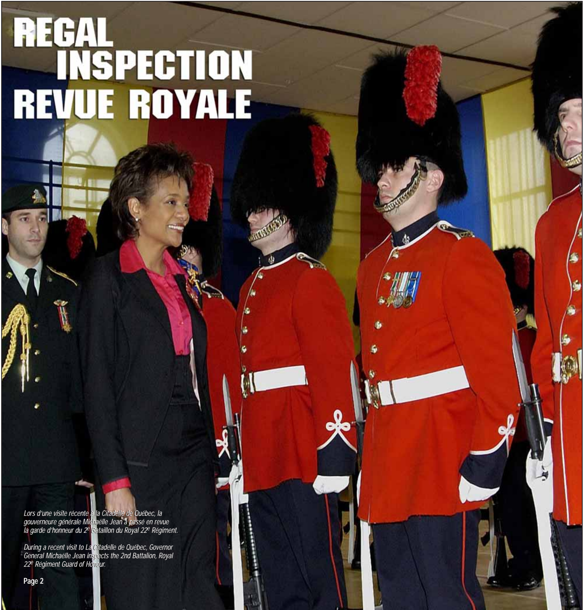
Lors d'une visite récente à la Citadelle de Québec, la gouverneure générale Michaëlle Jean a passé en revue la garde d'honneur du 2 e Bataillon du Royal 22 e Régiment.