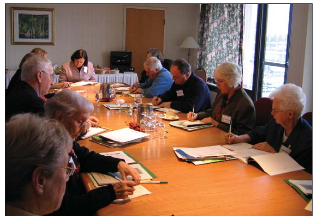
Atelier régional des aînés sur la recherche, région de l'Atlantique, novembre 2004 : session en petit groupe

Au cours de la prochaine année, l'Institut sera l'hôte, en Ontario et au Québec, de ses deux derniers ateliers régionaux, et il entreprendra une consultation unique avec les Canadiens du Nord. ■