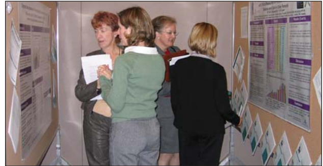
Forum canadien de recherche sur le vieillissement, octobre 2004 : jugement du concours d'affiches d'étudiants

L'Association canadienne de gérontologie (ACG), un des plus proches partenaires de l'Institut, est l'hôte chaque année du FCRV de l'IV, l'un des principaux volets de la réunion