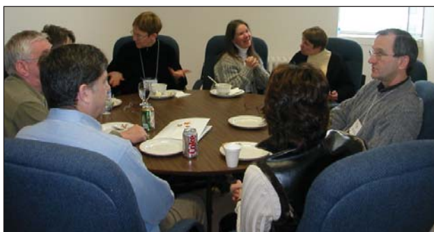
Réunion de l'équipe CanDRIVE

Le but de l'EVF CanDRIVE est d'améliorer la santé, la sécurité et la qualité de vie des conducteurs âgés du Canada. De 2003 à 2005, l'équipe a étendu son champ d'action en reconnaissant que les initiatives de recherche en matière de santé s'adressant aux conducteurs âgés devaient prendre en compte la triade interdépendante que forment le conducteur,