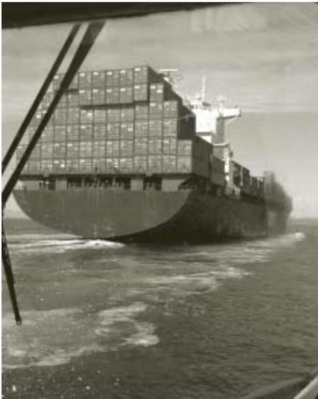
Porte-conteneurs vu d'un bateau pilote près de Brotchie Ledge, Victoria en Colombie-Britannique (2003)

œuvre des règlements pour décourager la concurrence pour l'entreprise ayant précédé Air Canada, Lignes aériennes Trans-Canada.