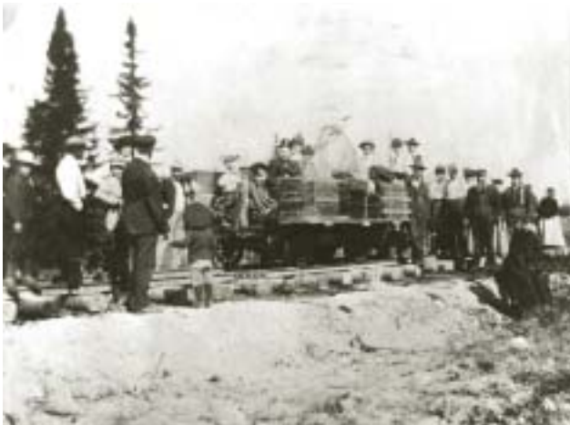
Premier train à The Pas : employés des chemins de fer et passagers avec baggages, The Pas (Manitoba) 1908

Le 28 mars 1908, James Pitt Mabee, juge de la Haute Cour de justice de l'Ontario, est devenu le nouveau commissaire en chef puis, le 29 juillet, l' Acte des chemins de fer a été amendé dans le but d'accroître la taille du conseil qui passa de trois à six membres. Une nouvelle disposition stipulait que « toute personne peut être nommée commissaire en chef ou commissaire en chef adjoint si elle est