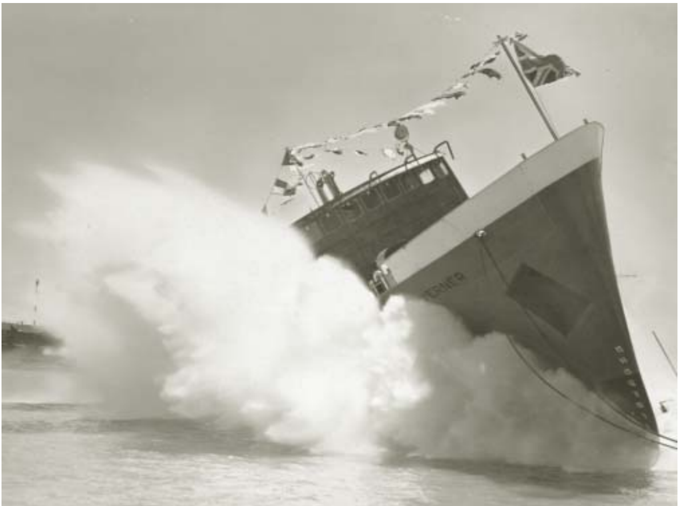
Lancement du caboteur de Labrador MV Taverner, Collingwood (Ontario) mai 1962