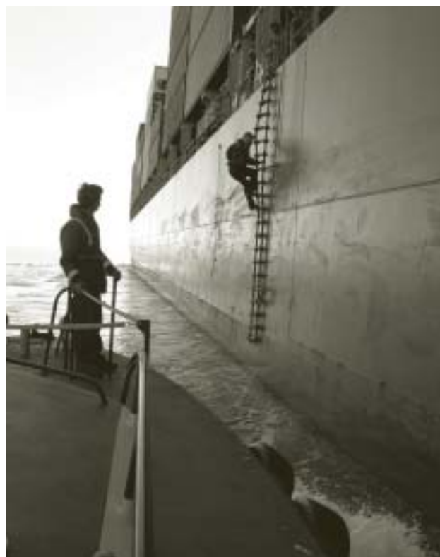
Pilote côtier descendant d'un navire à Brotchie Ledge, Victoria en Colombie-Britannique (2003)