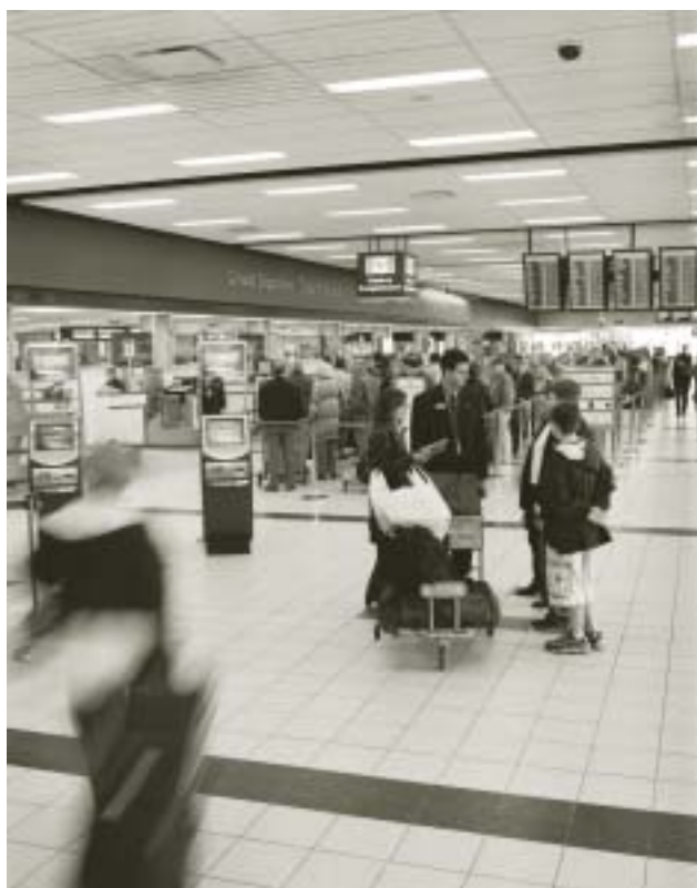
Un représentant à l'information aux passagers prête assistance à des voyageurs à l'aéroport international Pearson à Toronto (Ontario)

Erik Nielsen, ancien membre du Cabinet du gouvernement Mulroney, a été nommé à la tête du nouvel