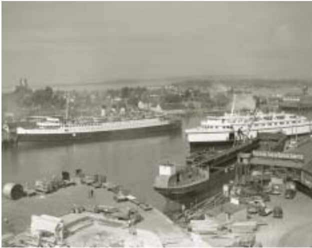
Havre de Victoria, face au sud-est, Colombie-Britannique 1947