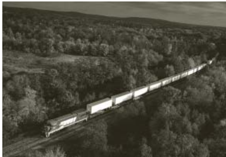
Des archives photographiques de l'Office des transports du Canada

marchandises et de voyageurs non rentables; l'élimination des restrictions relatives à la pénétration des services aériens dans le Nord afin que tous les services aériens intérieurs soient assujettis au même régime de délivrance des licences.