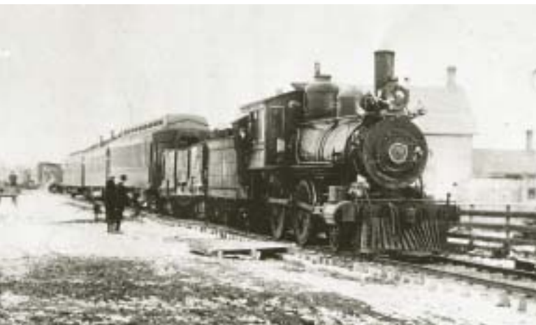
Premier train à voyageurs de Winnipeg à Edmonton — chemins de fer Canadian North, 1905

Dès le commencement, la Commission des chemins de fer a été confrontée à des obstacles. Selon la Railway Act ( Acte des chemins de fer ) de 1903, la Commission devait être inaugurée le 1 er février 1904. Cependant, comme le rapporte l' Ottawa Citizen le 2 février, les nominations à la Commission ont eu lieu « par décret en conseil et ont été