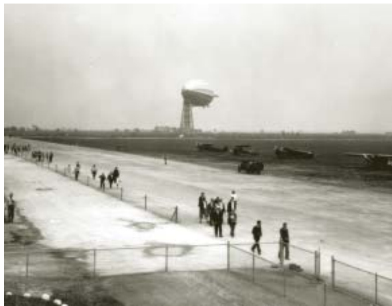
Des gens, des avions et le R.100 à Saint-Hubert (Québec), août 1930