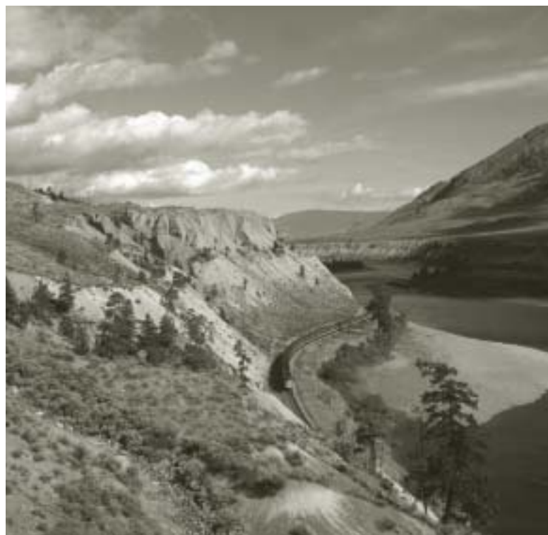
Photographie aérienne d'un train vers l'ouest, près de Kamloops (Colombie-Britannique) 1975

En 1975, une commission d'enquête dirigée par Emmett Hall, juge de la Cour suprême du Canada à la retraite, a été mise sur pied afin d'étudier les besoins des producteurs de grains, des exploitants de silos et d'autres entreprises connexes en matière de transport par rail. Entre-temps, le gel de l'abandon de 6 283 milles d'embranchements dans les provinces des Prairies a été prolongé et se terminerait en 1976. Bien que la commission Hall ait tenu des audiences dans les quatre provinces de l'Ouest, la Commission a autorisé l'abandon de 362 des 525 milles de voies ferrées non protégées dans les Prairies.