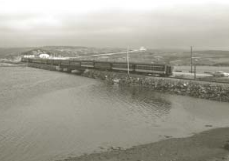
Train de voyageurs CN Newfie Bullet en route vers St. John's, Port aux Basques, Terre-Neuve et Labrador, 11 septembre 1967

En réponse aux plaintes des expéditeurs, le Parlement adopta la Freight Rates Reduction Act (Loi sur la réduction des tarifs marchandises) qui exhortait la Commission de réduire l'augmentation du tarif de 17 à 10 p. 100 et prévoyait que le gouvernement compense les compagnies de chemin de fer pour les pertes encourues. La Loi devait être temporaire. L'administration du fonds de compensation fut confiée à la Commission 15 .