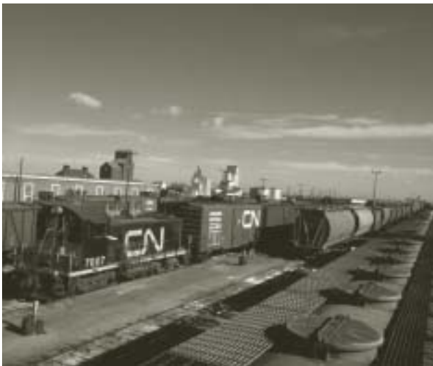
Train de potasse dans un triage, Melville (Saskatchewan) 1967