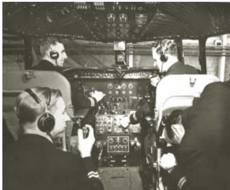
Équipage de TCA dans le cockpit d'un Canadair DC-4M North Star, 1950

Aux termes de la Loi sur les transports , la Commission exerçait une compétence sur les transports aérien et maritime; cependant, ses pouvoirs à l'égard de ces deux modes de transport étaient de portée beaucoup plus limitée qu'à l'égard du transport ferroviaire. Par exemple, en ce qui concerne le transport maritime intérieur, la Commission avait compétence sur la délivrance des permis et l'établissement des taux, mais n'avait pas l'autorité de traiter des autres questions. Au chapitre de l'aviation,