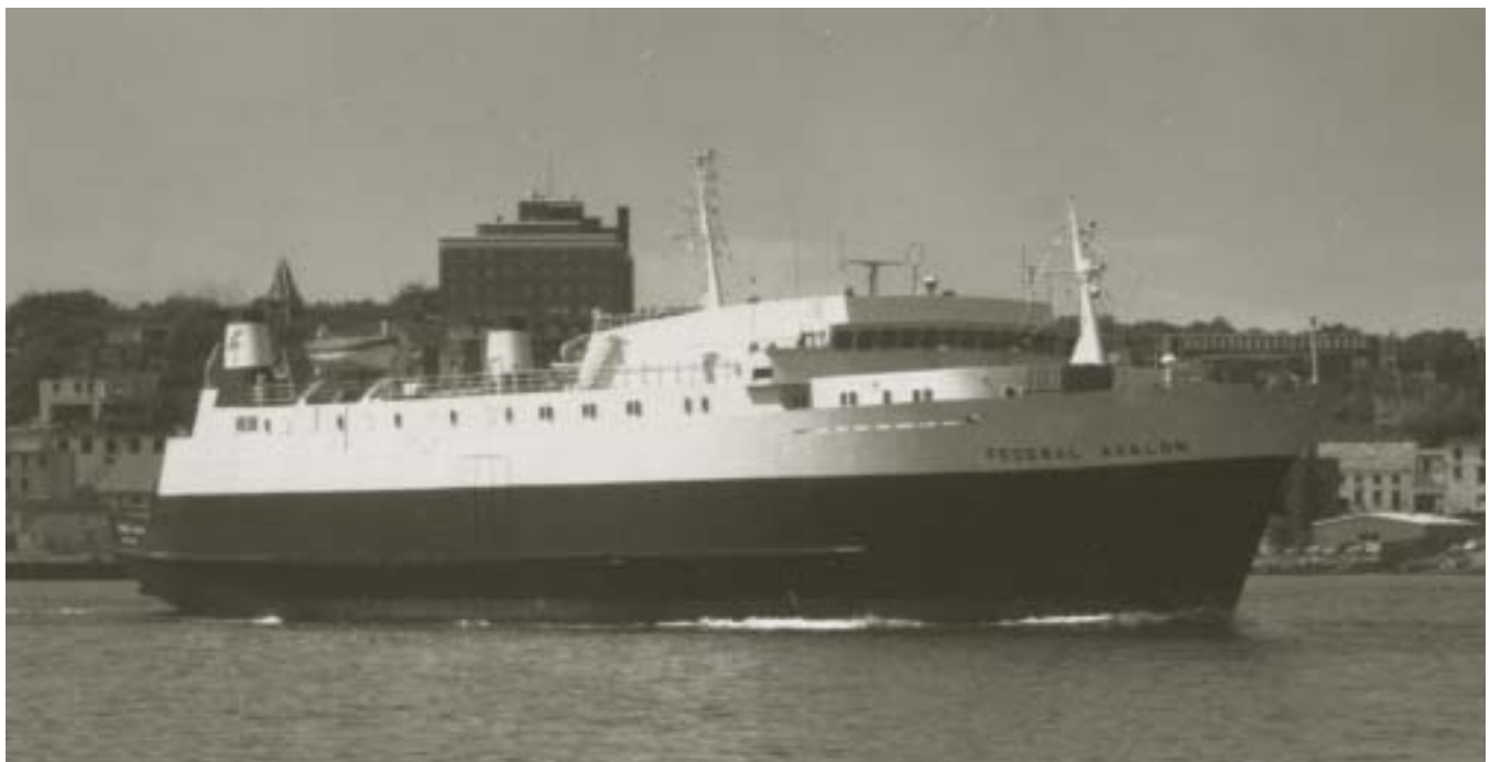
Bac MV Federal Avalon, St. John's (Terre-Neuve et Labrador) 1975