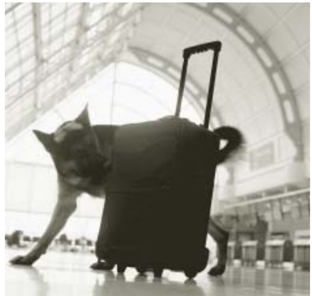
Membre de l'escouade canine de l'Autorité aéroportuaire du Grand Toronto qui vérifie les bagages à l'aéroport international Pearson à Toronto en Ontario (2002)

Le 11 septembre 2001, moins de deux mois après la diffusion du rapport, des avions détournés par des terroristes ont percuté le World Trade Center à New York, au Pentagone près de Washington et un avion s'est écrasé dans un terrain vague en Pennsylvanie, ce qui a plongé l'industrie mondiale du transport aérien dans un marasme. Deux mois plus tard, Canada 3000, décrit dans le rapport du Comité comme le plus important transporteur aérien d'affrètement au Canada, a déclaré faillite.