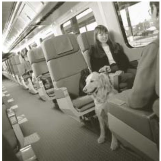
Un passager ayant une déficience visuelle et son chien-guide à bord d'une voiture de VIA Rail

détiennent. » Le reportage de Southam News a qualifié l'industrie aérienne canadienne de « duopole ».