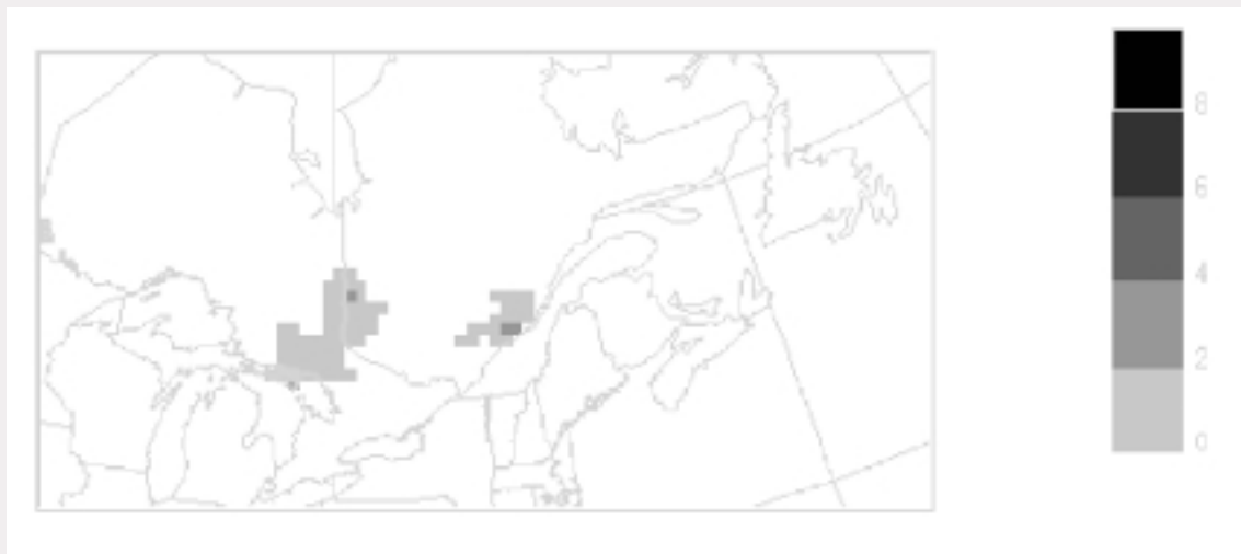
Figure 2 Superficie de l'est du Canada où l'on s'attend à ce que les dépôts de SO 2 dépassent les charges critiques (en kilogrammes par hectare par année), si les émissions sont réduites de 50 % en Ontario, de 50 % au Québec, de 30 % au Nouveau-Brunswick, de 25 % en Nouvelle-Écosse et de 60 % aux États-Unis

Remarque : Les zones ombrées reçoivent de 0 à 4 kilogrammes par hectare par année des dépôts acides au-dessus des charges critiques.