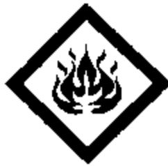
Figure 7.3 : Symbole « Inflammable » superposé au symbole « Avertissement ».

Les dimensions du symbole peuvent être établies selon la méthode décrite à la section 7.2.1, point a ). Les « pointes » du symbole (quatre dans ce cas) doivent toucher au cercle.