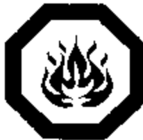
Figure 7.4 : Symbole « Inflammable » superposé au symbole « Danger ».

Les dimensions du symbole peuvent être établies selon la méthode décrite à la section 7.2.1, point a ). Les « pointes » du symbole (huit dans ce cas) doivent toucher au cercle.