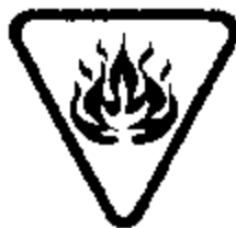
Figure 7.2 : Symbole « Inflammable » superposé au symbole « Attention ».

Les dimensions du symbole peuvent être établies selon la méthode décrite à la section 7.2.1, point a).