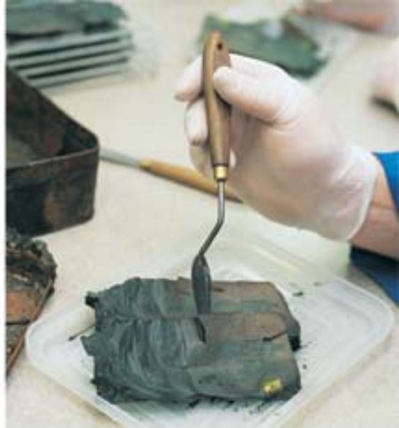
Les billets calcinés sont examinés attentivement au Service des billets brûlés. Chaque année, la Banque est appelée à déterminer, aux fins de leur remboursement, la valeur des billets brûlés, décomposés, déchirés, déchiquetés ou contaminés.

Les billets de banque ont une durée de vie limitée. La Banque du Canada est chargée de la destruction et du remplacement des billets usés. Lorsque les institutions financières lui retournent des billets, elle repère ceux qui sont impropres à la circulation et les envoie dans des sites d'enfouissement après les avoir déchiquetés.