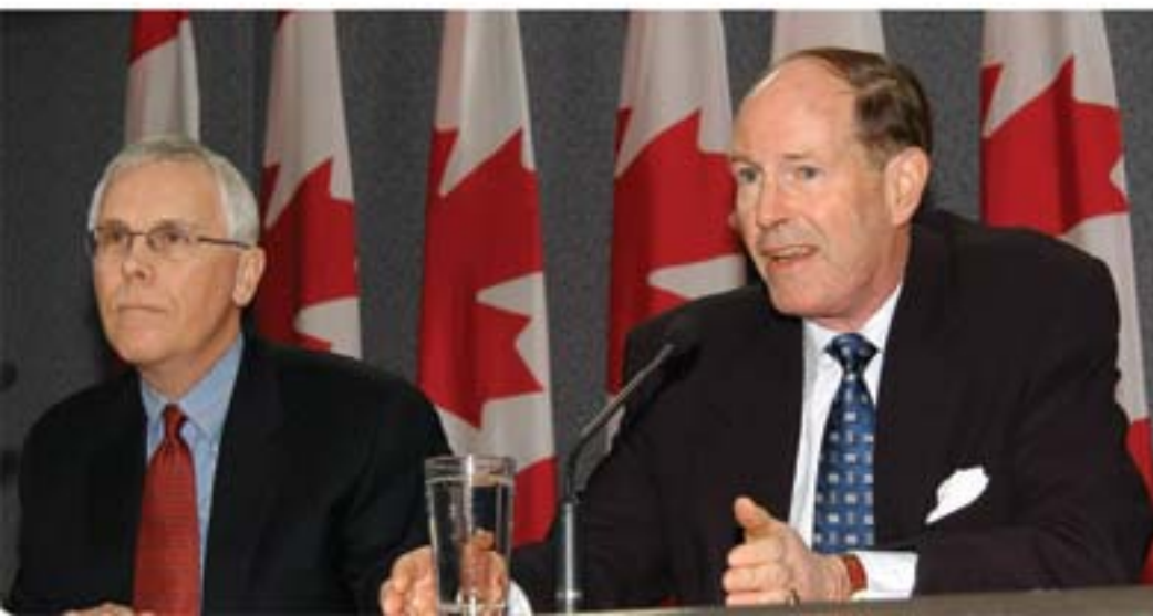
Le gouverneur M. David Dodge, et le premier sous-gouverneur, M. Paul Jenkins, lors d'une conférence de presse à l'occasion de la publication de la Mise à jour du Rapport sur la politique monétaire .

Les décisions de politique monétaire sont prises par le Conseil de direction de la Banque, qui se compose du gouverneur, du premier sous-gouverneur et des quatre sous-gouverneurs. Les stratégies, les politiques et les analyses économiques qui sous-tendent ces décisions sont expliquées quatre fois par année dans le Rapport sur la politique monétaire et la Mise à jour de ce dernier, ainsi que dans les allocutions prononcées régulièrement par les membres du Conseil de direction. La Banque expose également dans un communiqué les raisons de ses décisions relatives aux taux d'intérêt chaque fois qu'elle annonce le taux cible du financement à un jour.