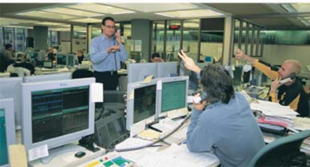
Au cœur de l'action dans la salle des marchés de la Banque

Le gouvernement fédéral finance ses activités principalement en prélevant des impôts et en contractant des emprunts sous forme surtout d'obligations et de bons du Trésor. La Banque du Canada gère ces émissions de titres et conseille le gouvernement à leur sujet. De plus, elle veille à ce qu'il dispose de soldes de trésorerie suffisants pour répondre à ses besoins quotidiens, et elle investit les soldes excédentaires. Elle lui fournit des avis sur sa politique de placement des réserves de change et s'occupe de la gestion de ces dernières.