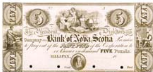
Avant la création de la Banque du Canada, la plupart des billets étaient émis par les banques privées. On pouvait les échanger contre des pièces d'or ou des billets du Dominion du Canada.

Loi sur la Banque du Canada afin de nationaliser l'institution. Le gouvernement fédéral en devint l'unique actionnaire en 1938 et l'est demeuré depuis.