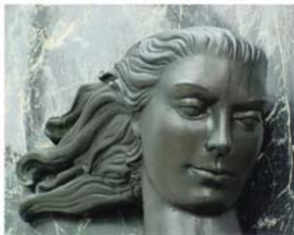
Détail du parterre en bronze sur la façade de l'immeuble du siège

Le Conseil de gestion se réunit à intervalles réguliers pour échanger des renseignements sur la gestion de la Banque et examiner les orientations proposées à l'échelle de l'institution. Il comprend les membres du Bureau supérieur de direction, les conseillers, les chefs de département et les directeurs des ressources humaines et des technologies de l'information.