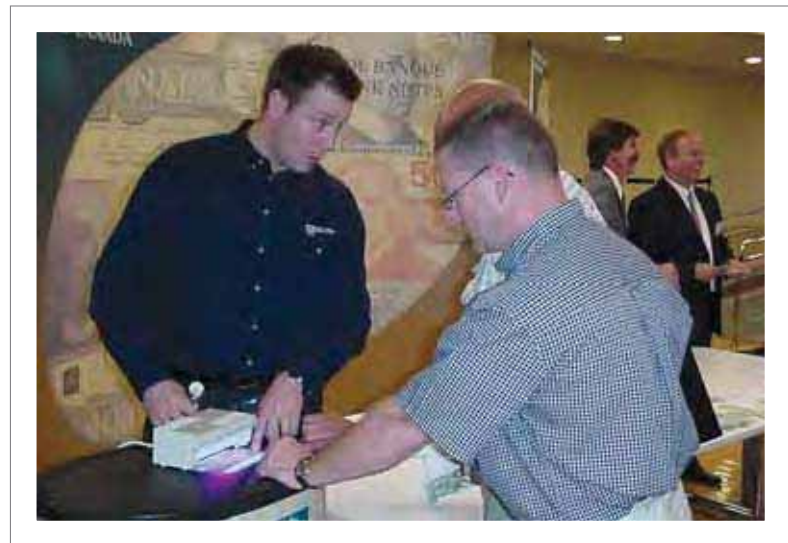
(Top left) Governor Gordon Thiessen and Deputy Prime Minister Herb Gray at the unveiling of the new $10 note, part of the Canadian Journey series, 17 January 2001. (Top right) Author Roch Carrier at the unveiling of the $5 note, 27 March 2002 in Montréal. The back of the note contains an excerpt from Carrier's much-loved children's book, The Hockey Sweater . (Bottom left) Governor David Dodge and then-Finance Minister Paul Martin at the unveiling of the $5 note. (Bottom right) A bank note information kiosk