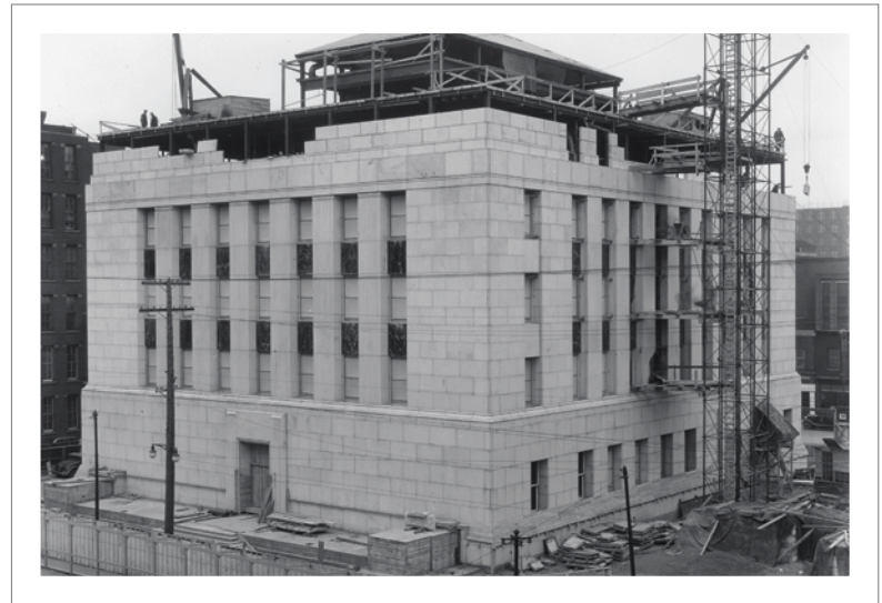
Construction of the Bank of Canada building progressed steadily throughout 1937. Clockwise from bottom left: 2 October, 3 November, 17 November, and 1 December. (Opposite) The Wellington Street entrance in 1938