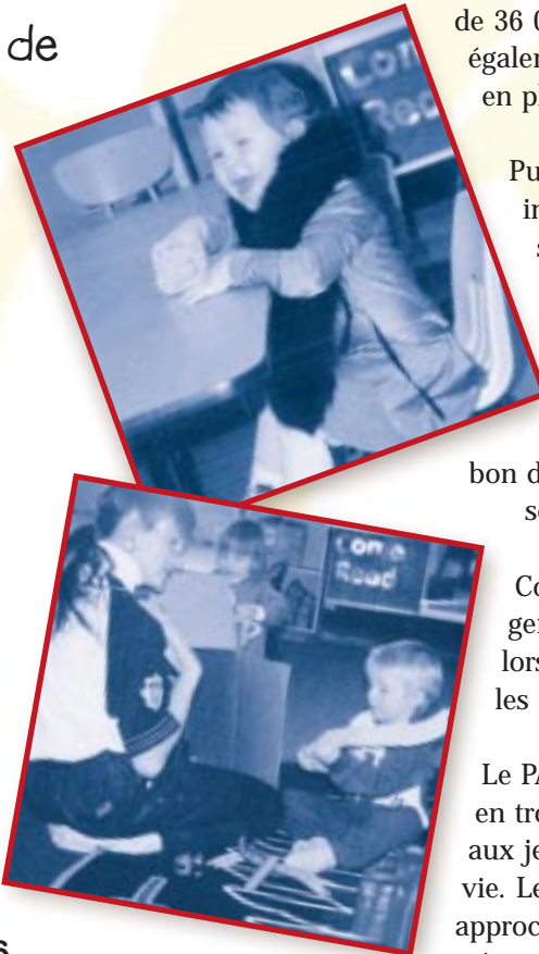
Un travailleur du PACE

« Une personne du milieu a eu une idée quelconque pour améliorer le sort d'une autre personne. Tout le monde a mis la main à la pâte en vue de perfectionner cette idée – elle a été peaufinée, révisée, adaptée aux circonstances et élaborée davantage. Grâce au travail d'équipe, cette idée a pris forme. Elle est devenue vivante et bien réelle. C'est ainsi que les choses se passent au niveau des projets du PACE. »