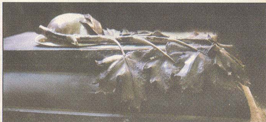
Detail of the bronze casting which will top the Tomb of the Unknown Soldier / Détails du moulage en bronze qui ornera le couvercle de la tombe du Soldat inconnu.