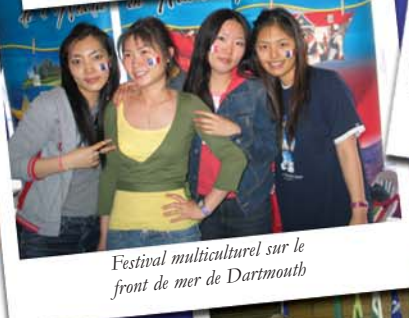
Festival multiculturel sur le front de mer de Dartmouth