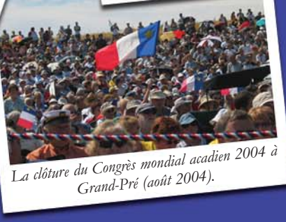
La clôture du Congrès mondial acadien 2004 à Grand-Pré (août 2004).