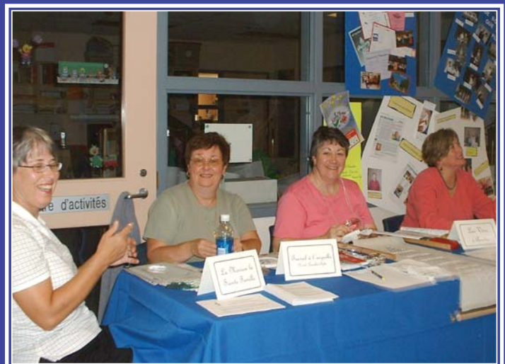
Participant à l'activité Journée portes ouvertes organisée par le Conseil communautaire du Grand-Havre.

Le Conseil communautaire du Grand-Havre a pour mandat de favoriser l'épanouissement et le rayonnement culturel, linguistique et social des résidents d'expression française et des francophiles de la municipalité régionale de Halifax.