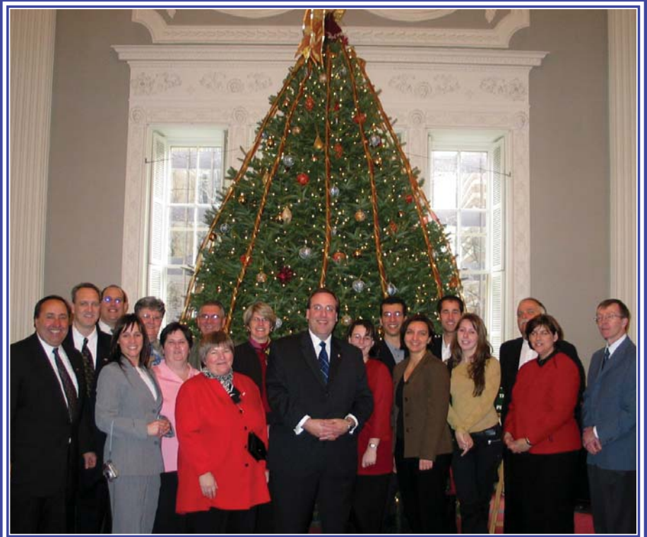
La communauté acadienne au salon rouge de l'Assemblée législative lors de la proclamation de la Loi 111 (décembre 2004)

Mis à part le Québec et le Nouveau-Brunswick, la Nouvelle-Écosse est la troisième province à adopter une telle loi après l'Île-du-Prince-Édouard et l'Ontario.