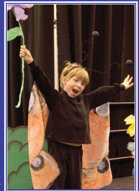
Membre de la troupe de théâtre Les Manies du Mercredi à Pomquet

La Société acadienne Sainte-Croix a pour mission de renforcer la vie culturelle et linguistique de la communauté acadienne et francophone de Pomquet et ses environs.