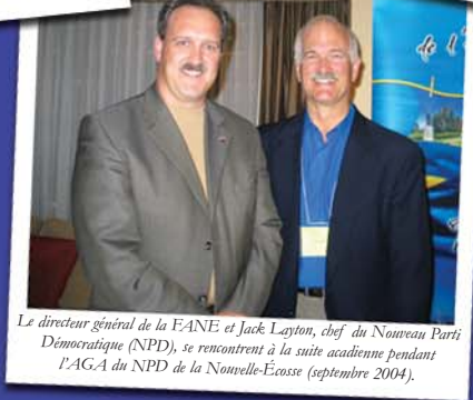
Le directeur général de la FANE et Jack Layton, chef du Nouveau Parti Démocratique (NPD), se rencontrent à la suite acadienne pendant l'AGA du NPD de la Nouvelle-Écosse (septembre 2004).