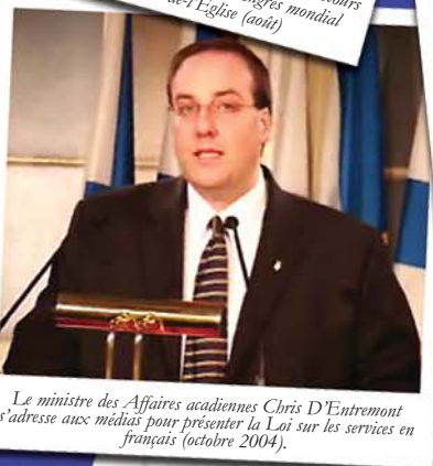
Le ministre des Affaires acadiennes Chris D'Entremont s'adresse aux médias pour présenter la Loi sur les services en français (octobre 2004).