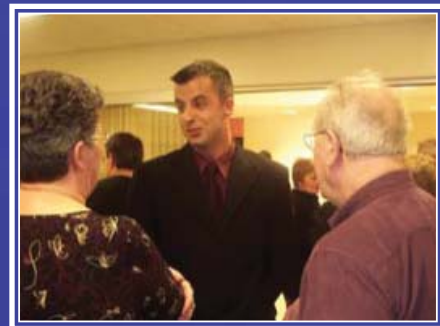
Le Centre communautaire Étoile de l'Acadie à Sydney accueille l'équipe du Téléjournal Atlantique de Radio-Canada.

Le Conseil communautaire Étoile de l'Acadie a comme mission d'encourager la communauté francophone du grand Sydney à vivre pleinement sa culture et à s'épanouir en stimulant l'émergence d'activités et de services socio-économiques à partir du centre scolaire communautaire Étoile de l'Acadie.