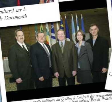
Forum sur la nouvelle politique du Québec à l'endroit des communautés francophones à l'extérieur du Québec où était présent Benoît Pelletier, ministre responsable du Secrétariat aux Affaires intergouvernementales canadiennes.