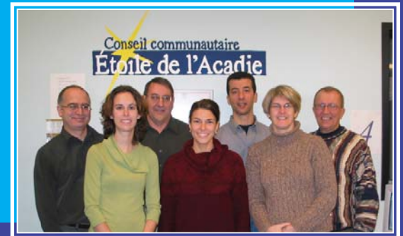
La coordonnatrice du Réseau acadien des sites PAC et l'équipe de la FANE visitent le comité régional et le site PAC à Sydney

région en technologie de l'informatique en offrant, à eux et aux visiteurs, l'accès à l'ordinateur, à Internet et aux nouvelles technologies de l'informatique au moyen de formations et de partenariats avec des institutions de formation, et en s'assurant que les programmes, logiciels et équipements sont à la fine pointe de la technologie.