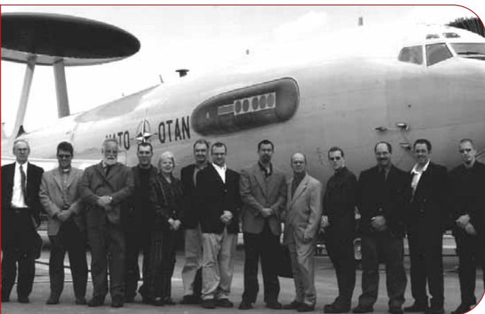
Les participants et organisateurs de la visite du FSD à l'OTAN ont pu voir un avion AWACS de près, lors de leur visite à la base aérienne de Geilenkirchen en Allemagne.

L'exercice 2003-2004 est déjà bien amorcé. Au cours du mois de juin, douze représentants de centres FSD ont