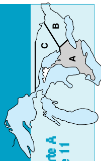
Tableau des divisions/espèces du SUD-OUEST DE L'ONTARIO (CARTE A)