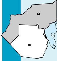
Tableau des divisions/espèces du NORD-EST DE L'ONTARIO (CARTE D)