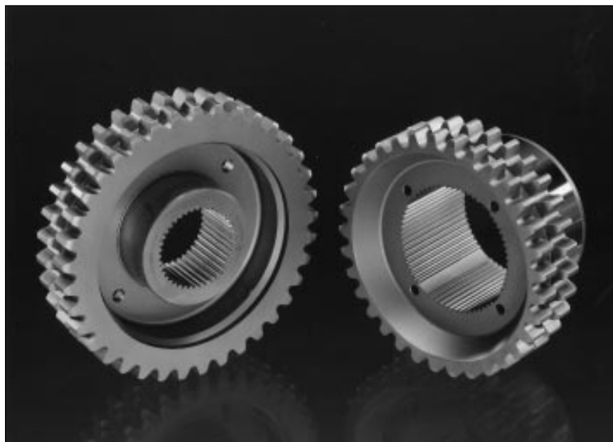
Pignons de transmission en métal fritté

En 1982, la société Stackpole avait une seule usine à Toronto, elle employait 85 personnes et son chiffre d'affaires était de 18,5 millions de dollars. En 1994, son chiffre d'affaires atteignait 104,8 millions de dollars, soit