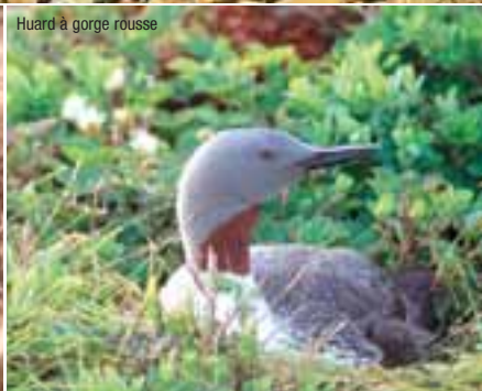
Huard à gorge rousse