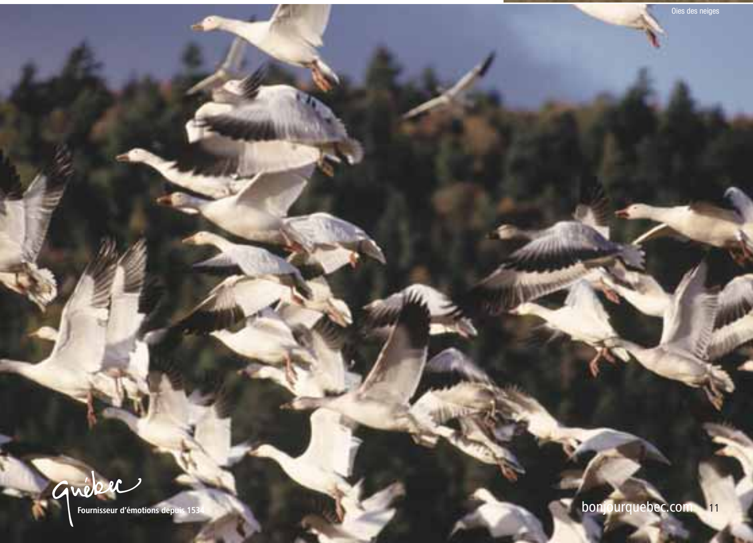
Oies des neiges