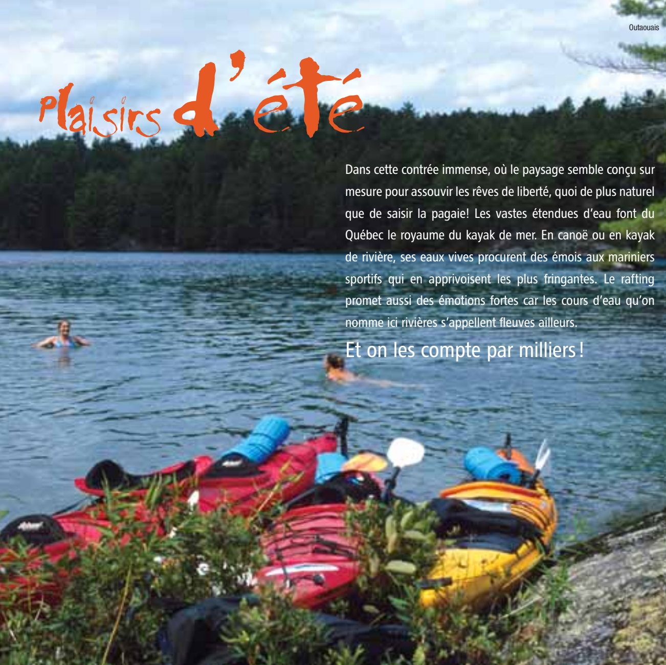
Parc national de la Gaspésie