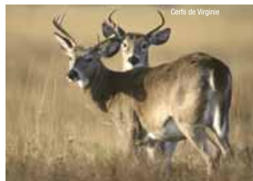
Cerfs de Virginie

La récompense ultime d'une odyssée dans la grande nature? L'apparition d'une minuscule fleur arctique émergeant de la toundra et du roc, d'un cerf ou d'un caribou au détour d'un sentier particulièrement exigeant, d'aiglons sortant la tête du nid. L'appareil photo est sans contredit le compagnon idéal des périples de haut calibre. Il immortalise des moments enchanteurs et fait du grand voyageur... un reporter!