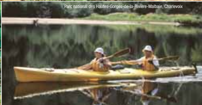
Parc national des Hautes-Gorges-de-la-Rivière-Malbaie, Charlevoix