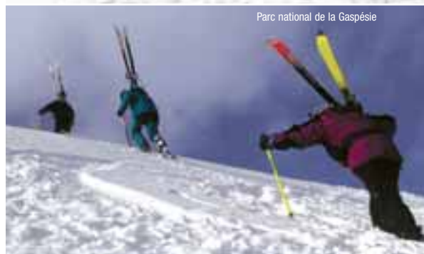
Parc national de la Gaspésie