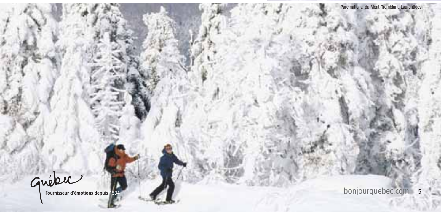
Parc national du Mont-Tremblant, Laurentides