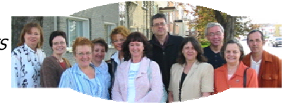
Les membres de la Table EES

Ce fut également l'occasion de rappeler que l'économie communautaire procure du travail à 850 personnes à Rouyn-Noranda et à 3 400 en Abitibi-Témiscamingue. Après pareille démonstration, on peut dire que les entreprises d'économie sociale, ça rapporte!