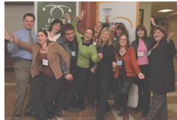
Les membres du comité organisateur

Ce fut également l'occasion de rappeler que l'économie communautaire procure du travail à 850 personnes à Rouyn-Noranda et à 3 400 en Abitibi-Témiscamingue. Après pareille démonstration, on peut dire que les entreprises d'économie sociale, ça rapporte!