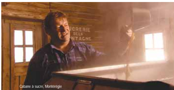
Cabane à sucre, Montérégie

Pendant la saison hivernale, tout est prétexte aux divertissements et à la fête. Carnavals, festivals, et concours de sculpture sur glace s'enchaînent tout l'hiver jusqu'au temps des sucres, qui marque le retour du printemps !