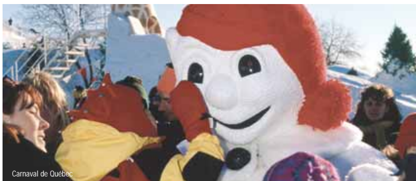
Carnaval de Québec