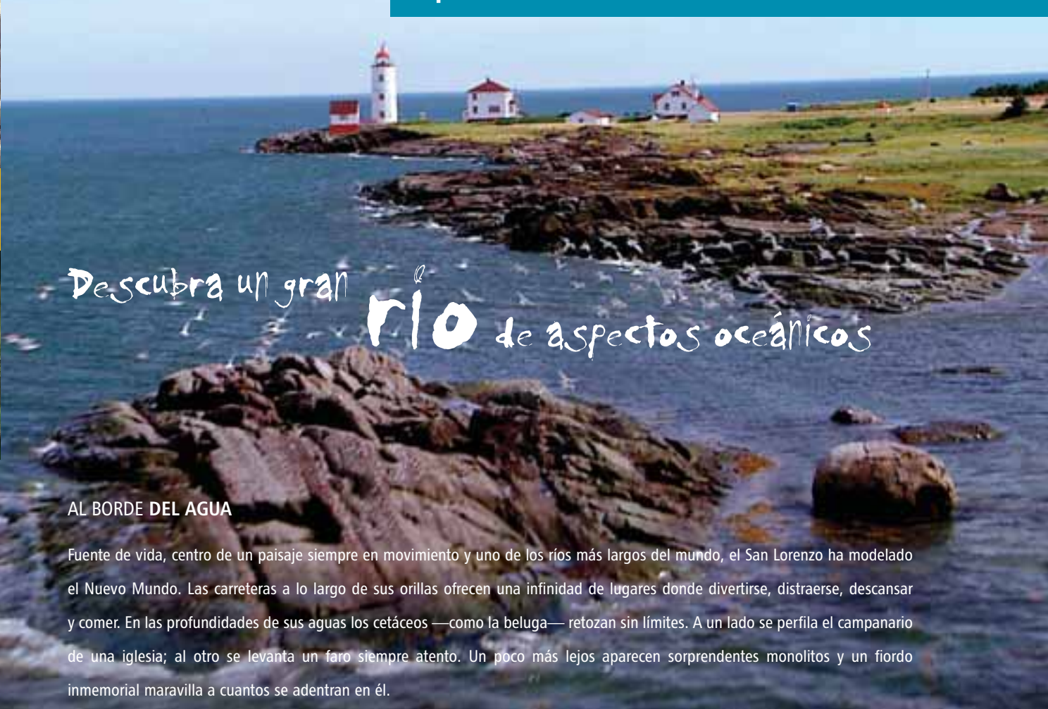
Isla Verde, Bajo San Lorenzo

Descubra un gran río de aspectos oceánicos