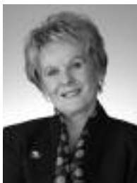
MONIQUE GAGNON-TREMBLAY MINISTRE DES RELATIONS INTERNATIONALES ET MINISTRE RESPONSABLE DE LA FRANCOPHONIE

L e Québec se présente sur la scène internationale depuis plus de cent ans comme la seule société nord-américaine à majorité francophone. Fier de son identité, partie prenante à l'ensemble canadien et pleinement intégré à ce continent, le Québec est une société de savoir, à l'économie moderne disposant de ressources naturelles abondantes.