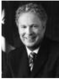
JEAN CHAREST PRIMER MINISTRE DEL QUEBEC

D uns anys ençà, els esdeveniments s'han anat precipitant en el pla històric. Alguns països de l'anomenat tercer món s'han fet un lloc entre les potències econòmiques mundials. La circulació de béns, de mercaderies i de persones ha experimentat una gran transformació, i la revolució tecnològica ha canviat la relació amb la informació, amb la qual cosa ara les imatges viatgen amb la mateixa rapidesa que els capitals.