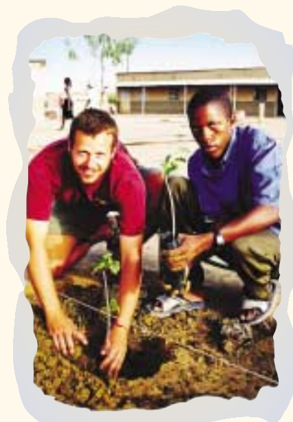
Club 215 (Sénégal)

Les organismes de coopération internationale membres de l'AQOCI sont responsables de la mise en œuvre, de l'organisation et de l'encadrement des stages, en collaboration avec leurs partenaires du Sud.