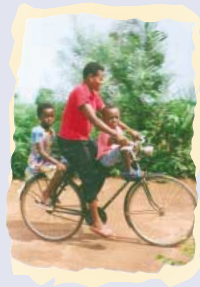
Cycle Nord-Sud (Togo)

Ce troisième volet du programme vise à appuyer et à consolider les organismes de coopération internationale voués principalement à l'éducation du public à la solidarité internationale.