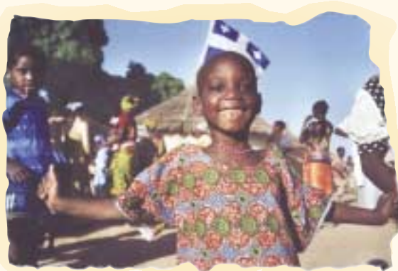
SUICO (Solidarité – Union – Coopération) (Mali)

L'appui accordé aux organismes de coopération internationale (OCI) se concrétise dans trois programmes.