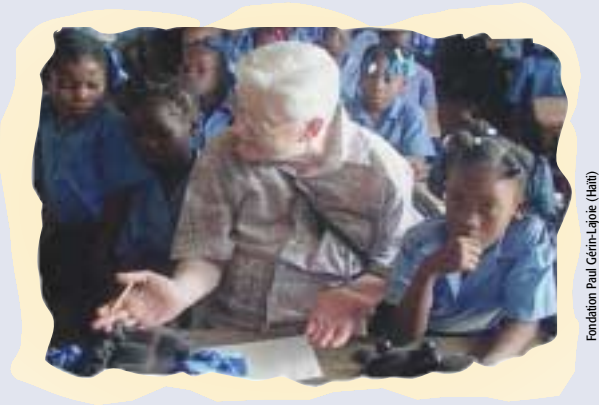
Fondation Paul Gérin-Lajoie (Haiti)

Le Programme québécois de développement international permet de soutenir des projets réalisés dans le respect des principes suivants :