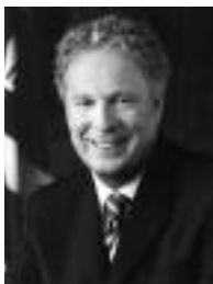
JEAN CHAREST MINISTER-PRESIDENT VAN QUÉBEC

S inds enkele jaren volgen de historische gebeurtenissen elkaar snel op. Zogenaamde derdewereld landen werken zich op tot economische grootmachten. Het verkeer van personen, goederen en handelswaar maakt een kentering door en de technologische revolutie zorgt ervoor dat we nu anders omgaan met informatie. Beelden en kapitaal verplaatsen zich razendsnel over de aardbol.