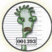
Samuel le rebelle Salmonelle