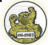
Ernest la peste E. coli O157:H7