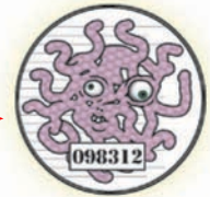
Catherine la mesquine Campylobactériose jejuni