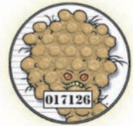
Chantale la brutale Shigella