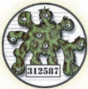
Cédrique le toxique Clostridium botulinum