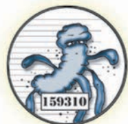
Laurent le turbulent Listéria monocytogenes