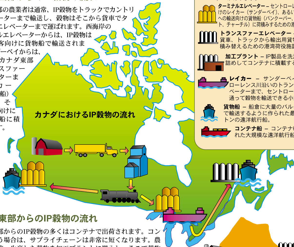
カナダにおけるIP穀物の流れ

カナダ西部の農業者は通常、IP穀物をトラックでカントリーエレベーターまで輸送し、穀物はそこから貨車でターミナルエレベーターまで運ばれます。西海岸のターミナルエレベーターからは、IP穀物は輸出先顧客向けに貨物船で輸送されます。サンダーベイからは、IP穀物はカナダ東部のトランスファーエレベーターまでレイカー（湖水運航船）で運ばれ、そこで輸出向けに海洋貨物船に積載されます。