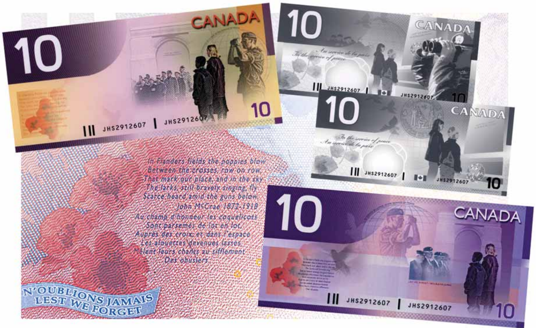
These computer-generated models for the back of the $10 note illustrate the progression towards the final design.