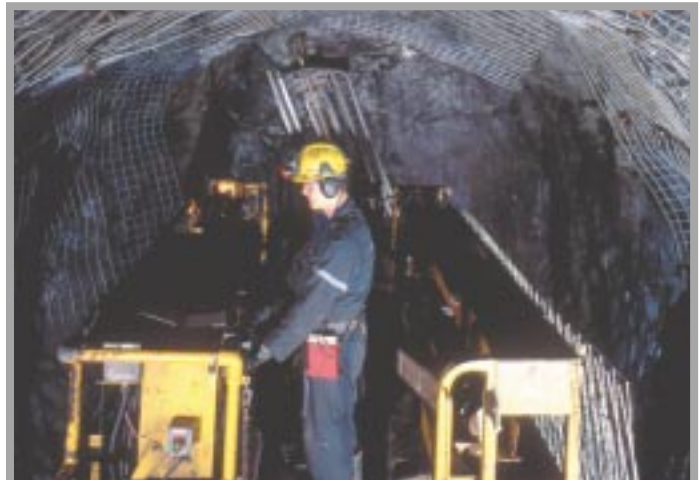
Les sociétés canadiennes aident l'industrie minière à améliorer la santé et la sécurité des mineurs partout dans le monde.

Les sociétés canadiennes livrent maintenant des produits et services dans plus de 100 pays. Ces ventes représentent plus de la moitié du total de leur chiffre d'affaires.