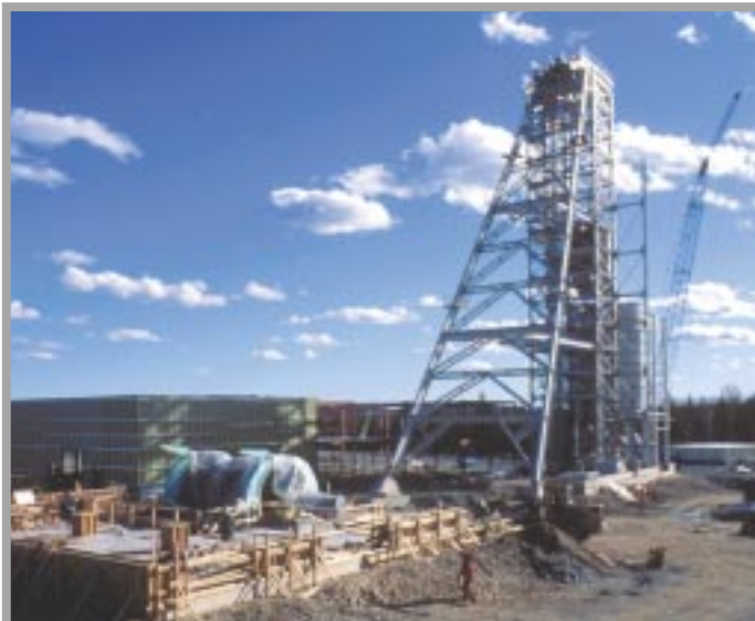
L'exploitation minière est la plus ancienne industrie de haute technologie du Canada.

Les fournisseurs canadiens soutiennent l'industrie mondiale de l'exploitation minière grâce à leurs solutions novatrices, sûres et fiables adaptées aux besoins particuliers de leurs clients.