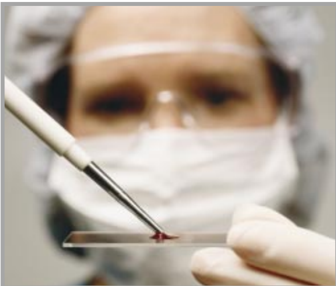
Uma pesquisa precisa e exaustiva é a norma padrão na indústria biofarmacêutica canadense.

O Canadá ocupa uma boa posição no setor de produtos biofarmacêuticos, com uma expectativa de triplicar sua fatia de mercado na venda mundial de remédios com receita, devendo atingir 15% até 2005.