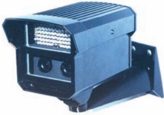
Câmera Integrada Dia e Noite equipada com sensores CCD, duas lentes e um conjunto infravermelho para desempenho ideal dia e noite.