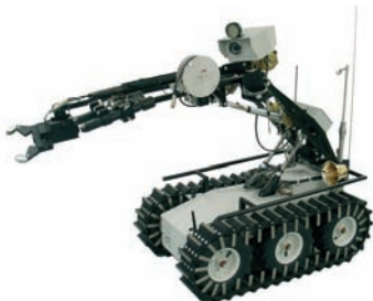
Investigador Móvel Remoto usado pela polícia e bombeiros, instituições nucleares, militares e industriais em todo o mundo.