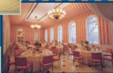
Salle de la Tente

Pour l'horaire détaillé des activités et des visites guidées : (613) 991-ggca (4422) • 1 866 842-ggca (4422) • www.gg.ca