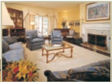
Salle de séjour

Stornoway est désignée en tant qu'édifice fédéral du patrimoine reconnu.