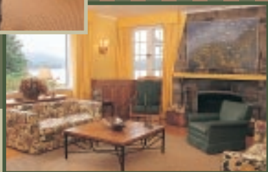
Salle de séjour