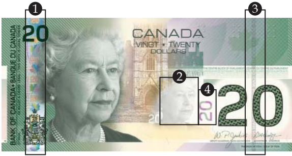
© Banque du Canada/Bank of Canada