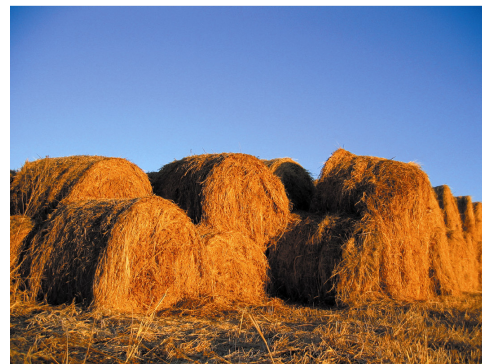
Meules de foin constituant la biomasse.