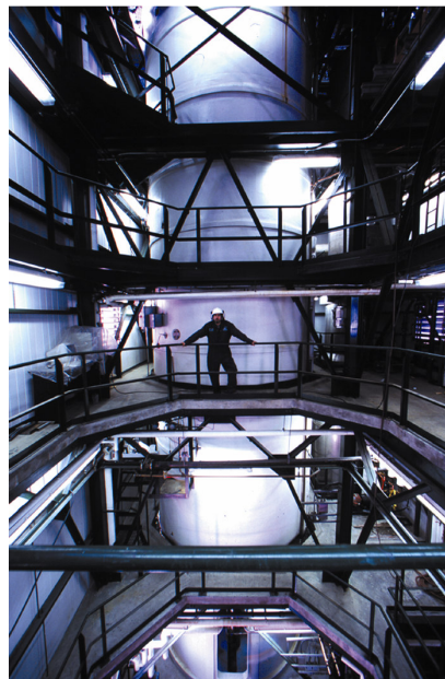
Installation de fermentation de la société Iogen

La digestion anaérobie. La digestion anaérobie est un procédé qui intervient naturellement et où le produit de la biomasse est décomposé, ou digéré, par les bactéries dans un milieu sans air. Ce procédé, utilisé dans les terrains d'enfouissement, permet de traiter une partie des eaux usées en milieu urbain, ainsi que d'autres eaux usées en milieu industriel. Plus récemment, la digestion anaérobie a fait son apparition dans les exploitations agricoles du Canada pour le traitement du fumier, des déjections animales et d'autres résidus agricoles. Les bactéries anaérobies entraînent la production de biogaz riches en méthane qui peuvent être transformés en chaleur et en électricité.