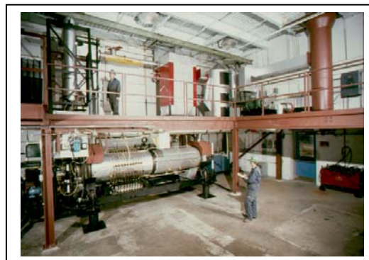
Figure 1 : Four rotatif thermique de 1 MW

Le four rotatif du CTEC-Ottawa mesure 4,27 m de longueur et ses diamètres intérieur et extérieur sont respectivement de 0,41 m et 0,66 m. Le revêtement intérieur est composé de matériau réfractaire coulé, résistant à la corrosion et aux températures élevées (jusqu'à 1200 °C). Le four est muni de barres de soulèvement, aussi composées de matériau réfractaire, afin d'en assurer l'alimentation continue et rapide et d'établir un contact étroit entre le gaz et les solides. Il est possible de régler la vitesse de rotation dans un intervalle de 3 à 6 tours/minute. La capacité de traitement de la matière d'alimentation, sous forme de solides ou de boues, varie de 20 à 200 kg/h. Le temps de séjour de la matière d'alimentation peut être réglé en modifiant la vitesse de rotation et l'inclinaison du four.