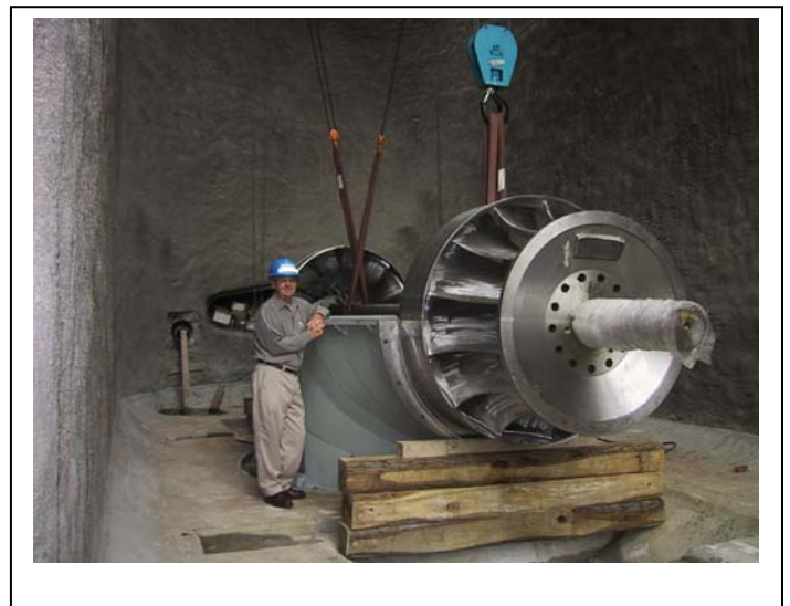
Turbine Francis Camelback améliorée, à la centrale n° II d'Énergie Ottawa

Le Laboratoire de Machines Hydrauliques (LAMH) de l'Université Laval, à Québec, est une composante clé des activités du CETC – Ottawa. Le LAMH est le seul