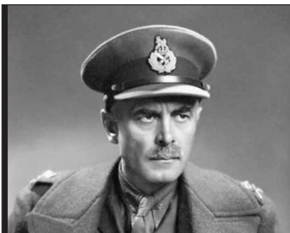
YOUSUF KARSH: NATIONAL LIBRARY AND ARCHIVES OF CANADA YOUSUF KARSH: BIBLIOTHÈQUE NATIONALE ET ARCHIVES DU CANADA

Parmi les Canadiens, seuls la 1 re Brigade et le 1 er Régiment d'artillerie de campagne, le Royal Canadian Horse Artillery, arrivent à se rendre jusqu'en France. Le Lgén Brooke ordonne un retrait général le 14 juin, au beau milieu du transit de la division. Au moment de la volte-face, la 1 re Division du Canada est éparpillée sur un U long de 600 milles, entre Aldershot et Le Mans.