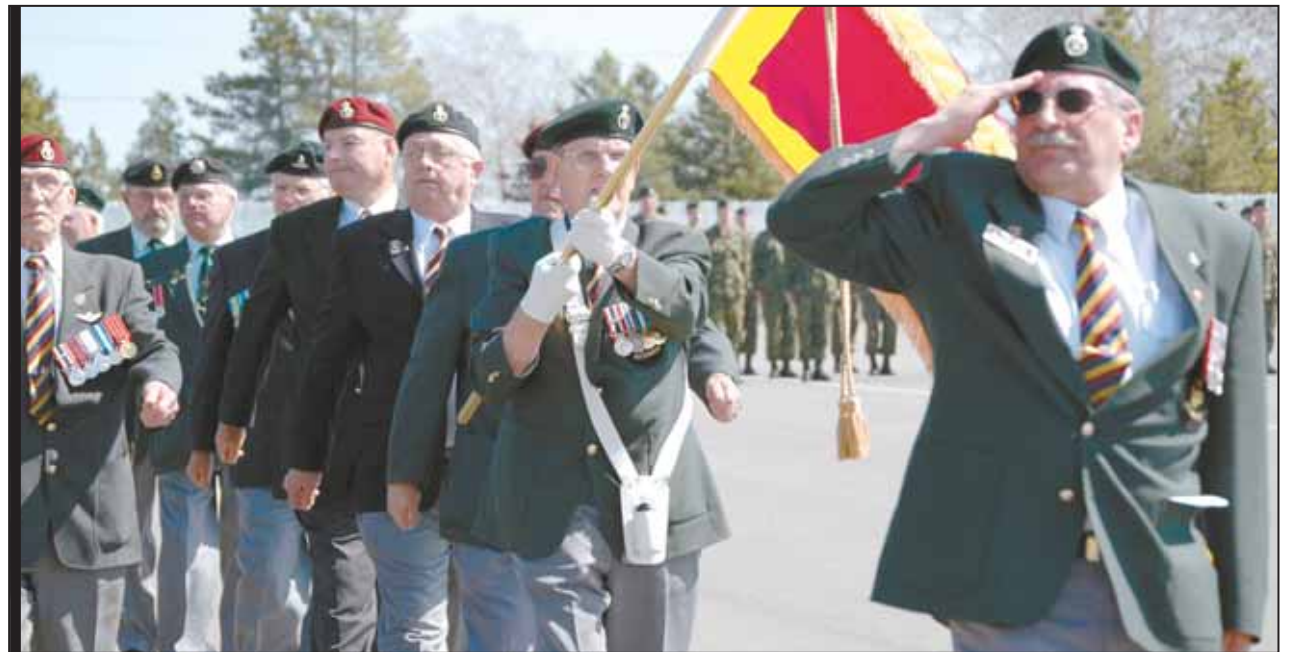
The Old Guard marches past the crowd as part of the 55th Anniversary of the Battle of Kapyong ceremonies held on the newly named Korea Parade Square.