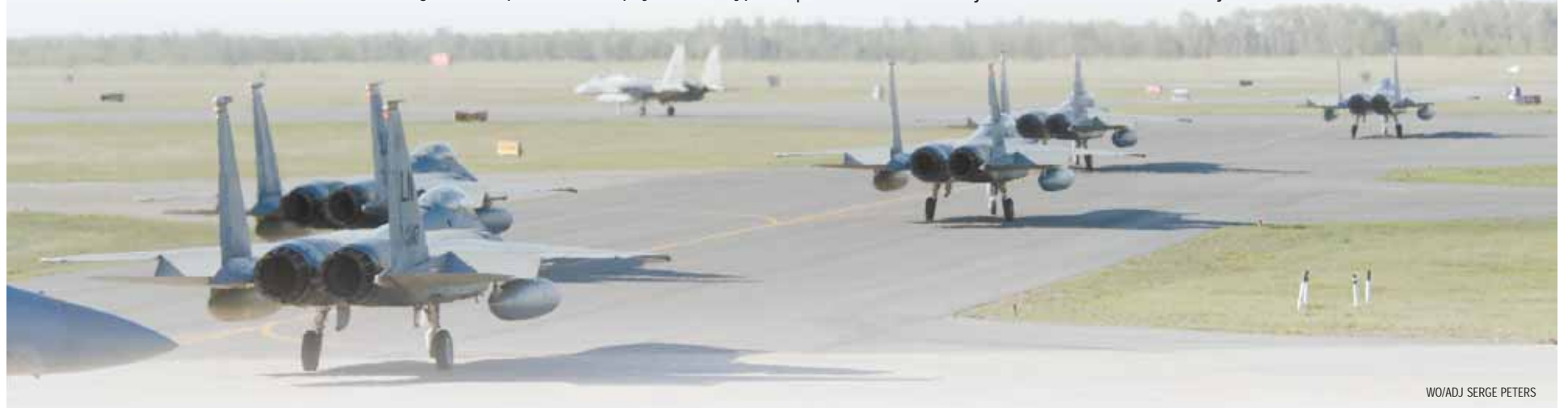
WO/ADJ SERGE PETERS

MAPLE FLAG 39 se poursuit jusqu'au 23 juin.