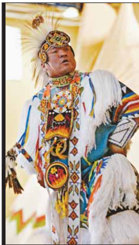
Dans le cadre de la SSAC, des membres du Programme de visite dans les écoles ont sensibilisé les militaires du manège militaire LCol Denison II, à Toronto, à la culture autochtone. Des joueurs de tambours et des danseurs ont effectué la danse pow-wow.

In pursuit of AAW, members from the Visiting Schools Program educate native culture to soldiers at LCol Denison II Armoury in Toronto. Drummers and Dancers performed a pow wow dance.