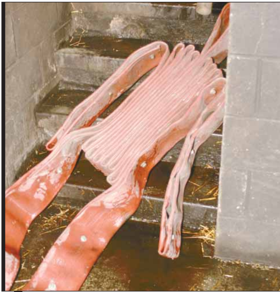
This "hose head", which weighs roughly the same amount as an adult, is used during a variety of training scenarios to simulate a casualty.

Il s'agit d'une distinction importante pour l'École, souligne-t-il. On tentera également d'élargir ses services, notamment