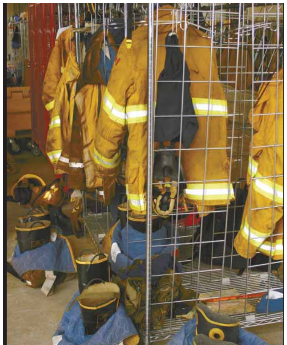
Uniforms and equipment hang at the ready at the CFFA training area at CFB Borden. Firefighters have mere seconds to dress when responding to a call.

But, that human aspect is a difficult dynamic to re-create in training. So "hose heads"—bodies fashioned from old hose—or "iron maidens"—made from metal are introduced into the scenarios.