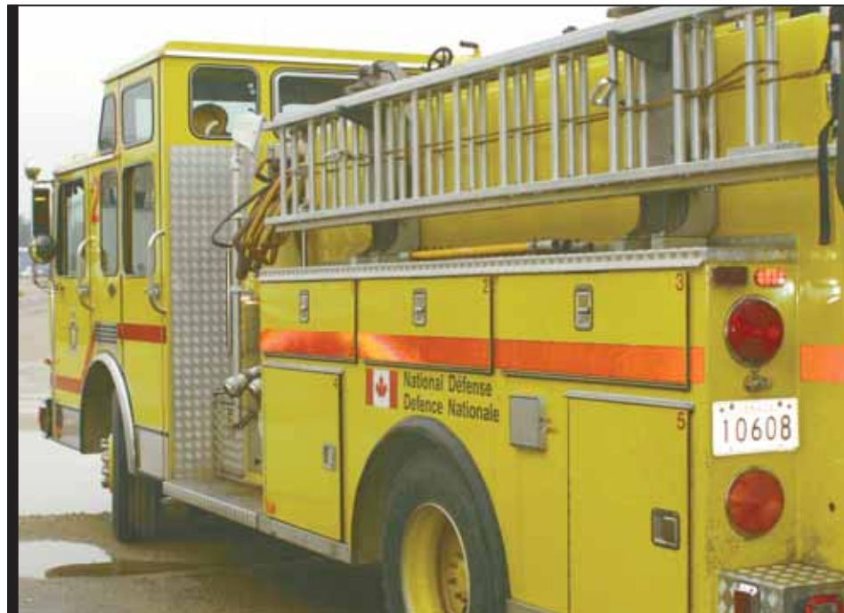
Fire trucks are housed in the realistic CFFA training area at CFB Borden. Candidates mount the trucks to respond to a variety of calls, complete with lights flashing and siren wailing.

Unlike fire halls in larger Canadian cities, CF/DND firefighters cannot specialize. Working in small teams they all must have extensive training. Skills range from Aircraft Rescue Fire Fighting,