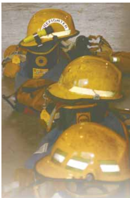
par Kristina Davis

BFC BORDEN — La fumée s'élève de l'aire d'entraînement pour se fondre dans la nuit. Poursuivie par les flammes, elle est poussée de plus en plus haut par une chaleur intense. En quelques minutes, la structure de béton au complet est avalée par les flammes et les explosions provenant d'une voiture à l'extérieur – engouffrée elle aussi par les flammes – perturbent l'air du soir.