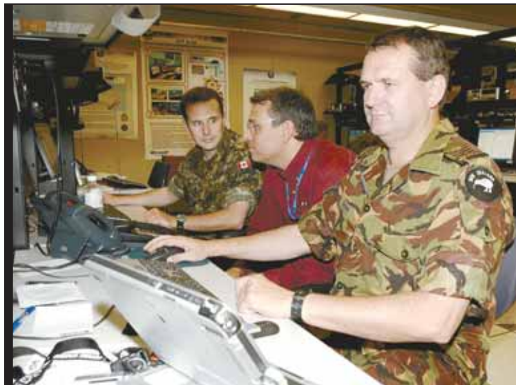
Des représentants de diverses entreprises de haute technologie présentent leurs produits aux participants du CWID.

Aucun frais d'inscription n'est exigé des participants. Toutefois, ce sont les entreprises, organismes militaires et agences gouvernementales qui doivent défrayer leurs propres coûts de déplacement des ressources humaines et technologiques.