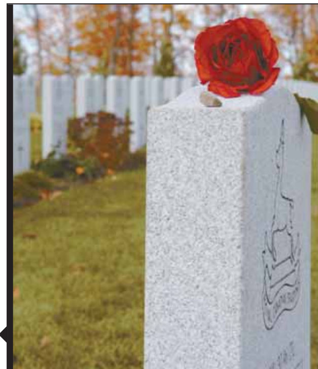
PTE/SDT JAX KENNEDY

Au Cimetière militaire national, une rose et une stèle sont déposées en l'honneur d'un soldat mort au combat.