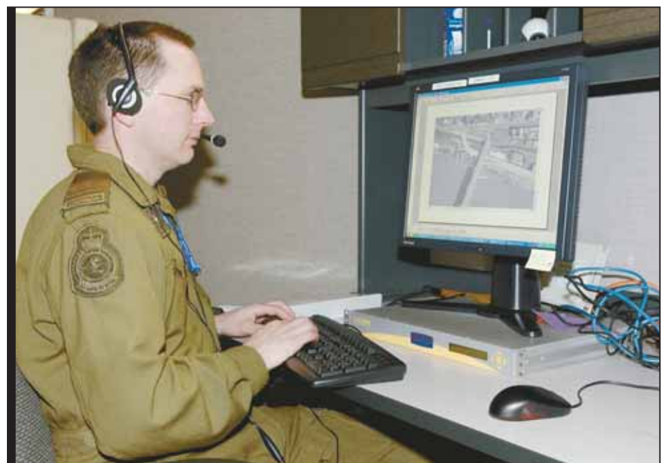
Dans le cadre d'un jeu de rôle, un membre de la Force aérienne du Canada planifie une mission en collaboration avec trois autres forces aériennes.

Although participants pay no registration fee, businesses, military organizations and governmental agencies must pay their own technology and human resource costs.