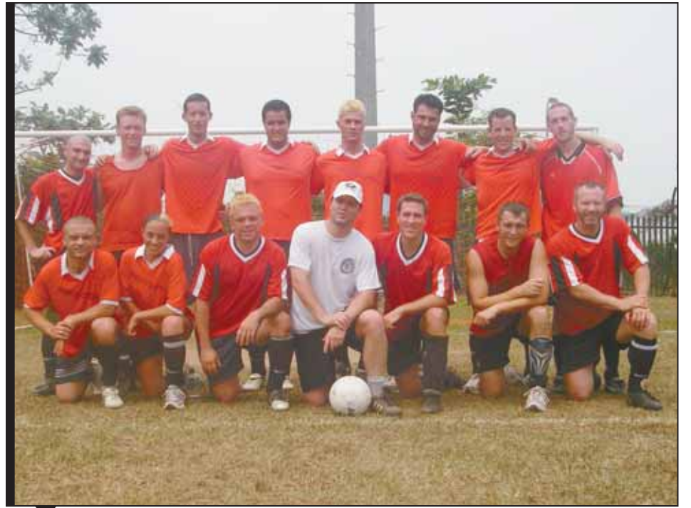
SLT/ENS 1 DEUTERKOM

During their upcoming stop in India, Ottawa sailors will have a chance to Christmas shop after participating in an extensive amphibious exercise named MALABAR.