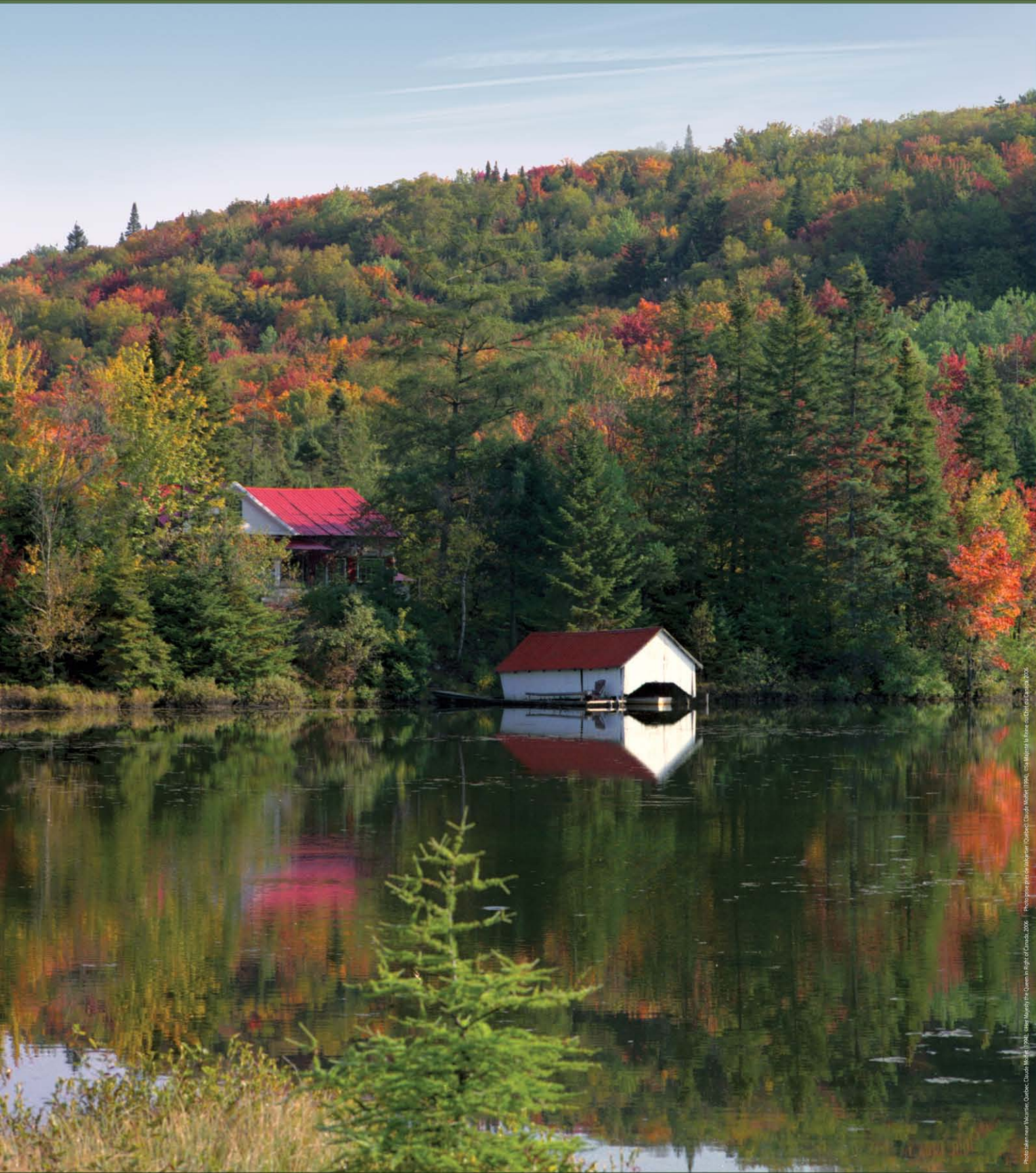
Photo: Kennewick, Quebec, Canada, 1998. Photo: Kennewick, Québec, Canada, 1998.

La Semaine nationale de l'arbre et des forêts, du 24 au 30 septembre 2006