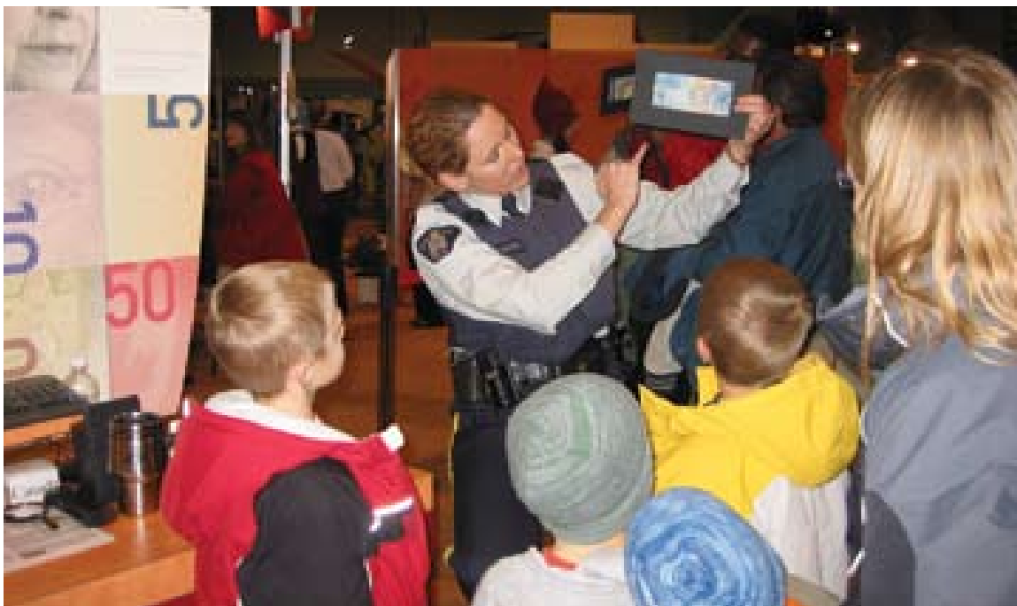
Une agente de la GRC montre comment vérifier les éléments de sécurité des billets lors de l'exposition agricole Agribition, tenue à Vancouver.

En 2006, la Banque a étendu la portée de son programme d'observation de la loi et en a renforcé l'efficacité.