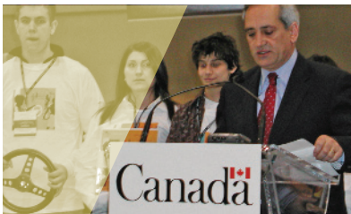
//L'honorable Tony Ianno lance la nouvelle trousse Le Bon $ens au volant.

Comme par le passé, le matériel cible un public adolescent, mais il s'intègre aisément aux programmes d'enseignement de la conduite automobile visant tous les groupes d'âge. La nouvelle trousse est offerte gratuitement aux écoles de conduite qui en font la demande à l'Office de l'efficacité énergétique de Ressources naturelles Canada. Les écoles qui s'inscrivent sur le site vehicules.gc.ca pourront voir leur nom affiché sur le site Web Le Bon $ens au volant.Ⓣ