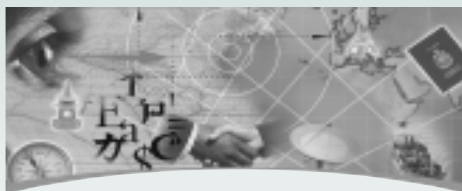
CINARS 2004 du 16 au 20 novembre 2004 Montréal (Québec)