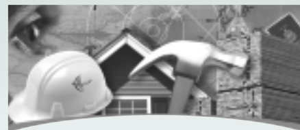
CONSTRUCT CANADA 2004 du 1 er au 3 décembre 2004 Toronto (Ontario)

Pour plus de renseignements sur ces foires, visitez le site Web du Service des délégués commerciaux du Canada, à l'adresse www.infoexport.gc.ca .