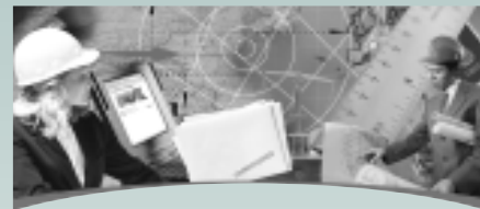
IIDEX/NeoCON CANADA 2004 les 30 septembre et 1 er octobre 2004 Toronto (Ontario)