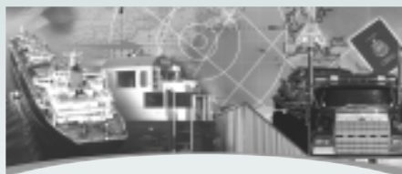
TRANS-EXPO 2004 ET CONGRÈS DE L'ACTU du 6 au 10 novembre 2004 Montréal (Québec)