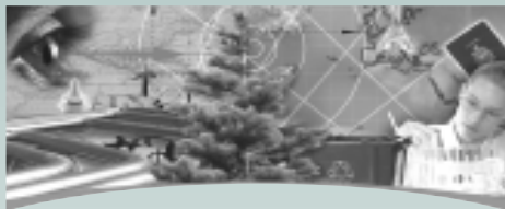
HYDROGÈNE ET PILES À COMBUSTIBLE 2004 — CONFÉRENCE ET FOIRE COMMERCIALE du 25 au 28 septembre 2004 Toronto (Ontario)