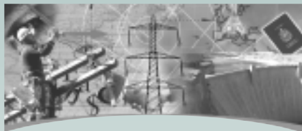
HYDROVISION 2004 du 16 au 20 août 2004 Montréal (Québec)

Grâce à un réseau de quelque 500 professionnels du commerce en poste dans plus de 140 villes aux quatre coins du monde, le Service des délégués commerciaux du Canada possède les connaissances dont vous avez besoin pour percer sur les marchés étrangers. Chaque année, des délégués commerciaux du monde entier reviennent au pays pour effectuer un suivi auprès d'entreprises canadiennes comme la vôtre et leur faire connaître de nouveaux débouchés. Cet automne, plusieurs délégués commerciaux en poste à l'étranger participeront à des foires commerciales au Canada. Rencontrez-les aux foires suivantes et découvrez des occasions d'affaires à l'étranger!