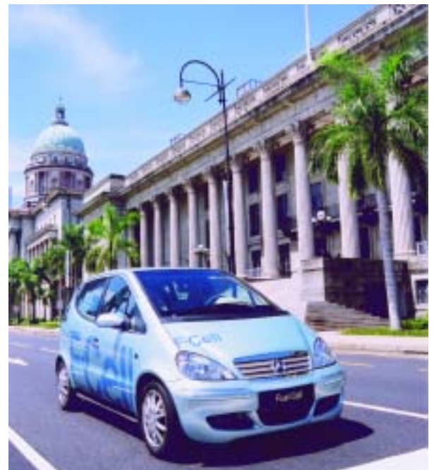
La première voiture à hydrogène d'Asie du Sud-Est, propulsée par Ballard Power Systems de Vancouver.