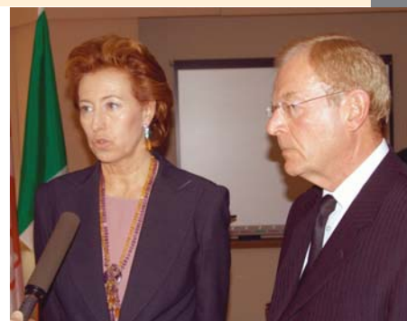
Letizia Moratti, ministre de l'Éducation, de l'Enseignement universitaire et de la Recherche de l'Italie, et Jim Peterson, ministre du Commerce international du Canada.

La ministre Moratti a pour sa part ajouté : « Cette déclaration permet d'accroître la collaboration entre nos deux pays par la création de