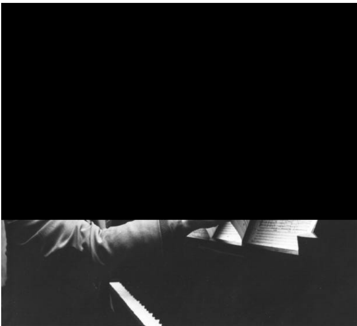
André Prévost devant une de ses oeuvres, 1977.

MUS 264/D2,34 Chorégraphie II (E=MC 2 ) . – 1976. – 1 document textuel. Dossier constitué d'un manuscrit autographe de la partition du chef (57 p.). Instrumentation : 3(pic, flA). 2+cor ang. 3(clpic, clB). 2+cbn - 4. 3(trp en ré). 3. 1, timb, perc, 2 hp, cél, pno, cdes. «Cette oeuvre a été commandée par l'Orchestre symphonique de Québec grâce à une subvention du Conseil des arts du Canada. La première a eu lieu le 6 avril 1976 à Québec par l'Orchestre symphonique de Québec sous la direction d'Otto-Werner Mueller».